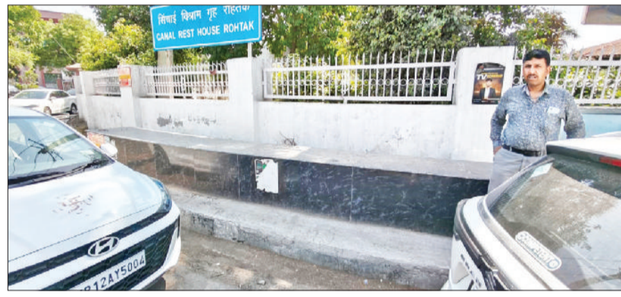
रोहतक। केनाल रेस्ट हाउस के पास नहीं दिखाई दिया सेल्फी प्वाइंट।

टूटा-फूटा माइक्रो होने की वजह से पानी मारी लीकेज है, जिससे जल संकट और गहरा जाता है। यदि समय रहते मजबूत और पूरी तरह से भूमिगत पाइपलाइन बिछा दी जाती, तो पानी की इस बर्बादी को काफी हद तक रोका जा सकता था। लेकिन वर्षों से लंबित यह काम अब भी फाइलों में अटका हुआ है। विभागों के बीच तालमेल की कमी और जिम्मेदारी से बचने की प्रवृत्ति का खामियाजा आम जनता को भुगतना पड़ रहा है, जो हर गर्मी में पानी के लिए जूझने को मजबूर हो जाती है।