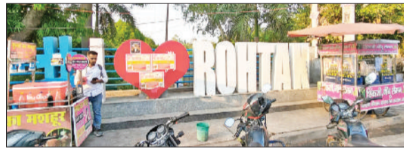
मानसरोवर पार्क के पास सेल्फी प्वाइंट पर लगे पोस्टर और सामने खड़ी रेहड़ियां।

शहर की सुंदरता बढ़ाने और लोगों को आकर्षित करने के उद्देश्य से नगर में बनाए गए सेल्फी प्वाइंट अब खुद बदहाली की तस्वीर बनते नजर आ रहे हैं। लाखों रुपये खर्च कर जाट कॉलेज, कैनाल रेस्ट हाउस, मानसरोवर पार्क और किला रोड पर तैयार किए गए ये सेल्फी प्वाइंट अपने मकसद पर खरे नहीं उतर पाए हैं। कहीं ये पूरी तरह गायब हो चुके हैं तो कहीं इनकी हालत इतनी खराब है कि लोग वहां रुकना भी पसंद नहीं कर रहे। जाट कॉलेज और कैनाल रेस्ट हाउस के पास बनाए गए सेल्फी प्वाइंट अब पूरी तरह गायब हो चुके हैं। स्थानीय लोगों का कहना है कि कुछ समय पहले तक यहां लोग फोटो खिंचवाने आते थे, लेकिन अब वहां इनका कोई नामोनिशान तक नहीं है। सवाल यह उठ रहा है कि इनको हटाया गया या वे खराब होकर खत्म हो गए, इस बारे में जिम्मेदार निगम