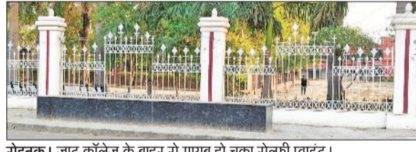
रोहतक। जाट कॉलेज के बाहर से गायब हो चुका सेल्फी प्वाइंट।

की ओर से कोई स्पष्ट जवाब नहीं दिया जा रहा। वहीं मानसरोवर पार्क में बना सेल्फी प्वाइंट भी अपनी पहचान खोता जा रहा है। इस पर जगह-जगह पोस्टर चिपकाए गए हैं। पार्क में घूमने आने वाले लोगों का कहना है कि यह जगह अब आकर्षण का केंद्र नहीं रही। हुआ करती थी, लेकिन अब इसकी