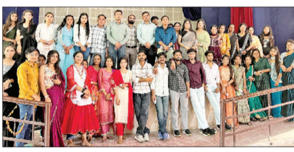
महम। विदाई पार्टी में भाग लेते भूगोल विभाग के विद्यार्थी और उनके साथ मौजूद प्राध्यापक।