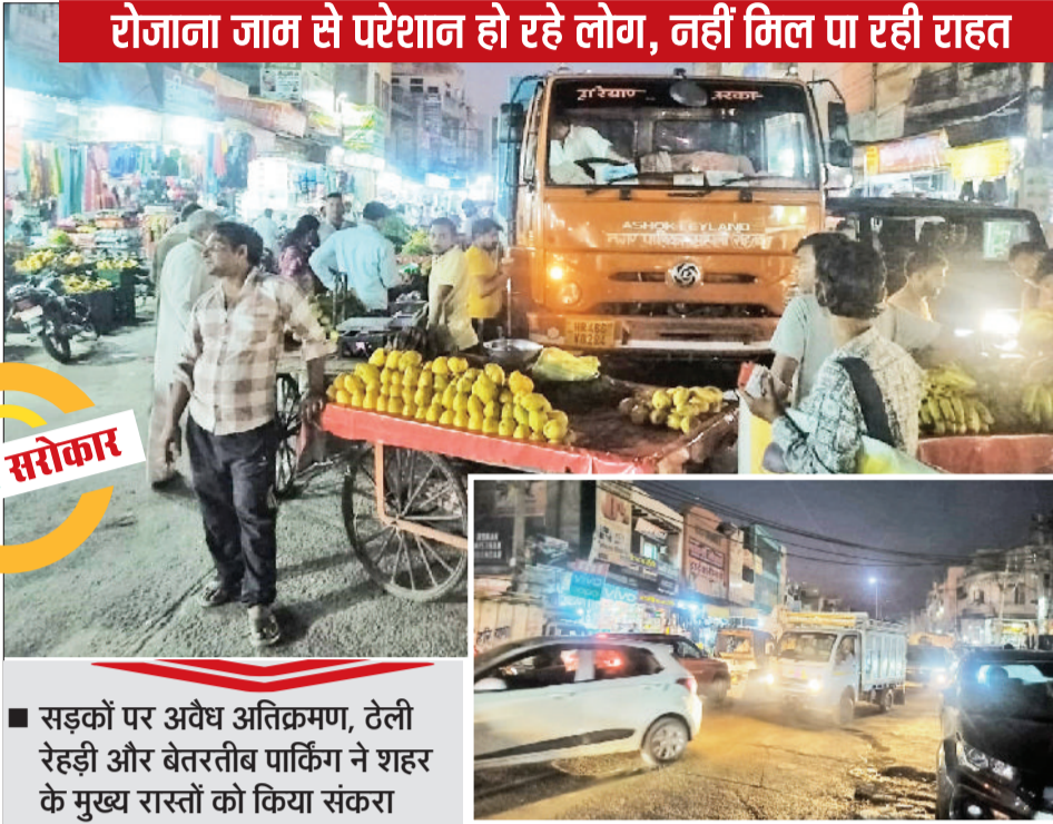
रोजाना जाम से परेशान हो रहे लोग, नहीं मिल पा रही राहत

सड़कों पर अवैध अतिक्रमण, टेली रेहड़ी और बेतरतीब पार्किंग ने शहर के मुख्य रास्तों को किया संकरा